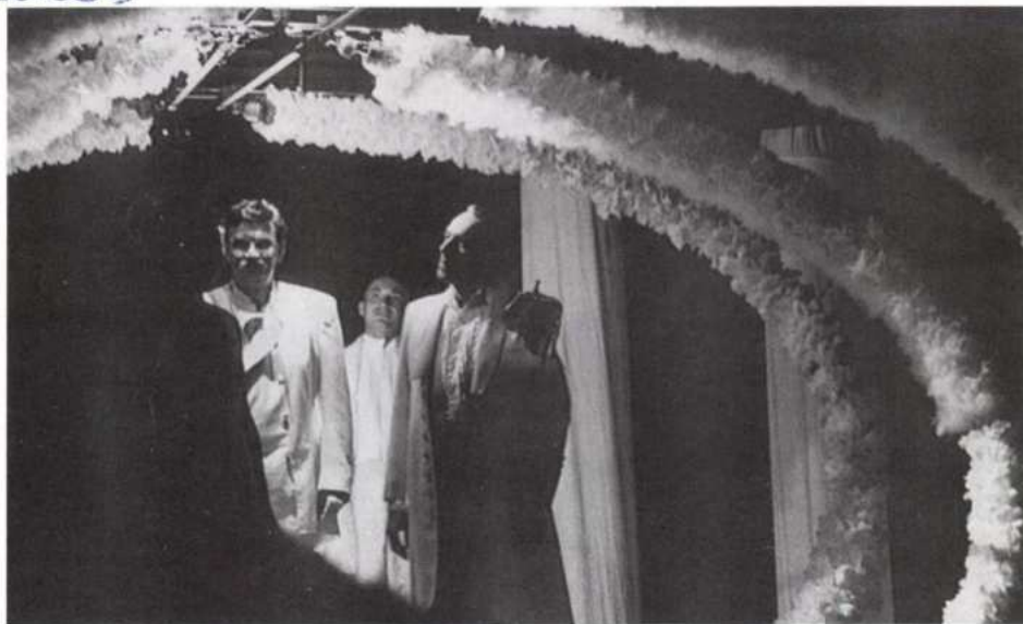
Jelenet a Katona József Színház előadásából