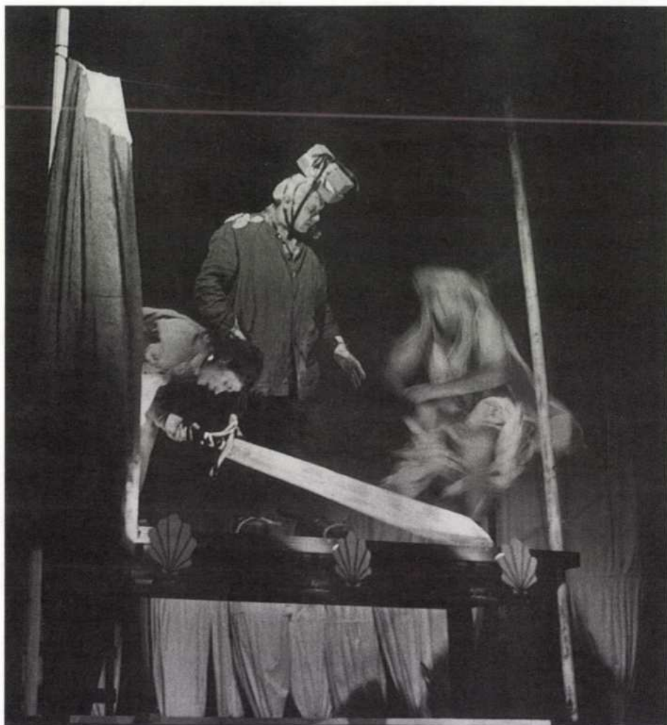
A mesteremberek előadása a Katona József Színházban (Koncz Zsuzsa felvételei)

Shakespeare általános nyelvéből rínak ki, inkább az adott szereplő adott helyzetében várható szövegéből. Amikor a darab vége felé Théseus és Hippolyta nézik a mesteremberek színjátékát, akkor Demetrius mond valamit, amire Hippolyta azt válaszolja: „Én még ilyen hülyeséget nem hallottam.” Ez tökéletesen belesimul a mai köznyelvbe, annak is egy — megengedem, nagyon semleges, de — nagyon lapos rétegébe. Itt viszont Hippolyta mondja, az amazonok királynője, aki ekkor már Théseus fejedelem felesége, ráadásul a darab végén, ahol Shakespeare-nél a kulturális rend és hierarchia általában helyre szokott állni. Megnéztem az eredetit, és rögtön világos lett, hogy Ádám abszolút hűséges akart lenni, mert ott az áll: „This is the silliest stuff that ever I heard” — ami ma tökéletes angol szleng. És tényleg a „legnagyobb hülyeséget” jelenti. Alighanem valamiféle nyelvtörténeti homonímia